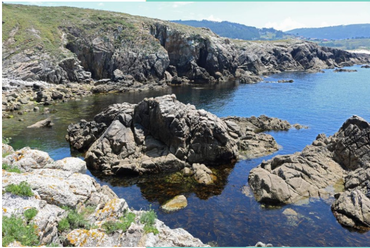
Punta da Parede