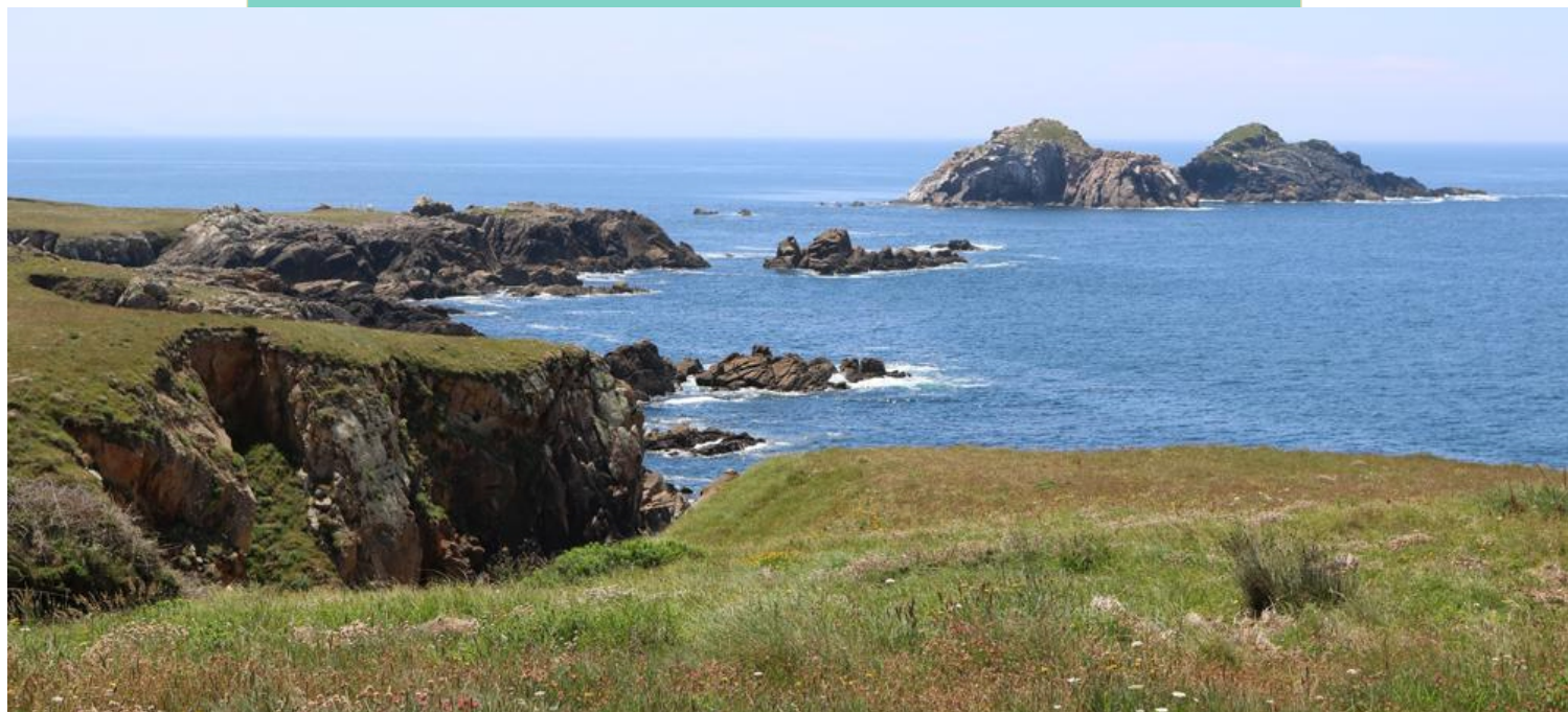
Punta Lavadoiro e illas Gabeiras