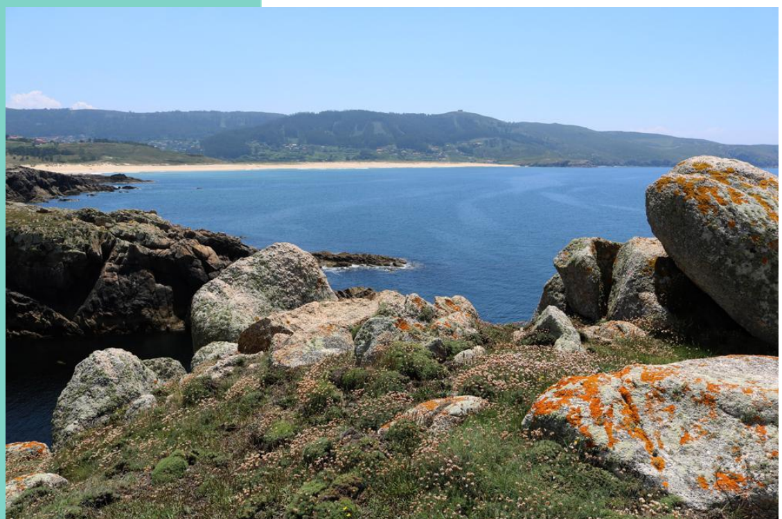
Vista de Doniños desde os cantís da punta do Castro