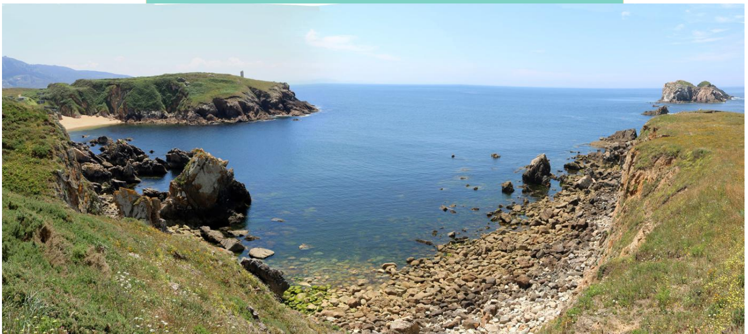
Vista da enseada e castro de Lobadiz