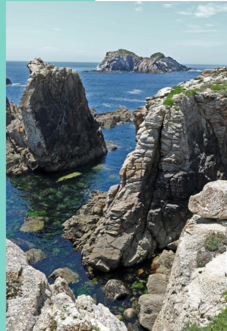
Punta Lavadoiro e illas Gabeiras