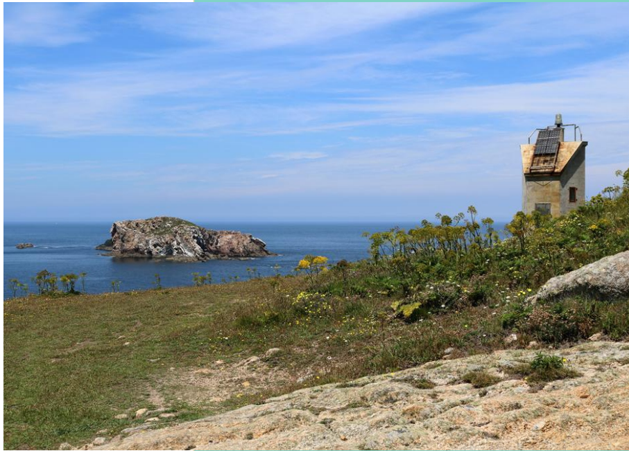
Punta do Castro, faro e illas Gabeiras