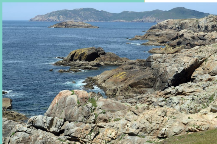
Punta e illa Herbosa