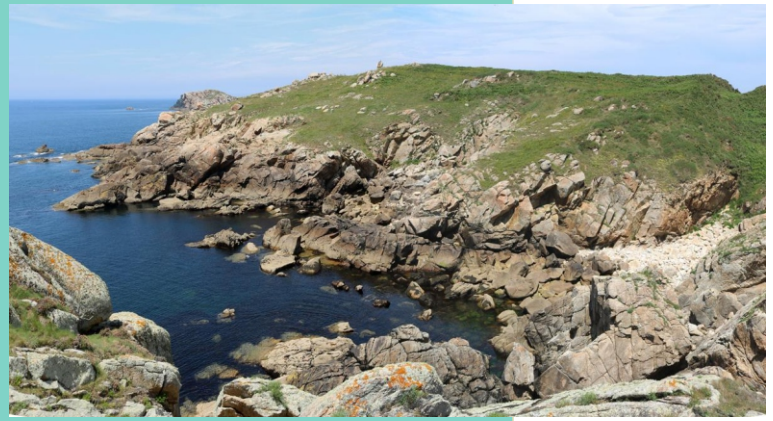
Punta do Castro de Lobadiz. Conserva a estrutura dun castro e desde ela hai espléndidas vistas panorámicas da costa.